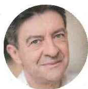
Jean-Luc Mélenchon Parti de Gauche