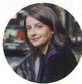
Cécile Duflot Europe Écologie Les Verts